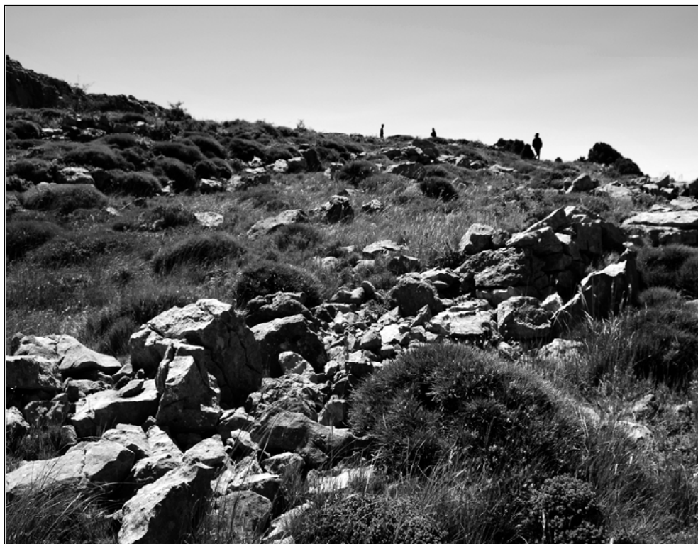
Marinet. Despulles de construccions.

Les diferents versions sobre l'Encant són així: