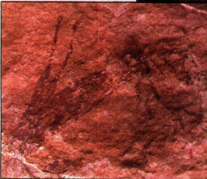
Arriba, vista de la zona de cuevas. Sobre estas líneas, detalle de un ciervo a la carrera en la Cova d'en Josep

Físicamente, este barranco constituye el curso central de una