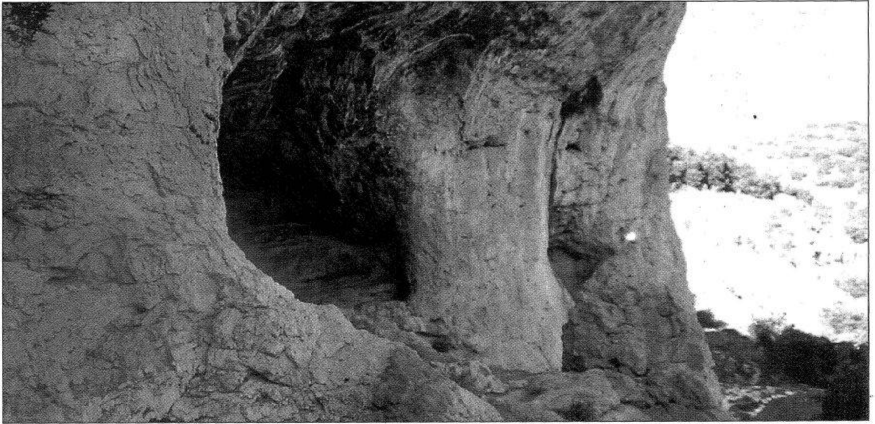
Cova Negra o del Polvorero, en Xodos, morada del Home de la Pólvora, donde fabricó munición y fue asediado varias veces por las fuerzas gubernativas.

Al cesar la intensa actividad bélica del siglo pasado las zonas montañosas de Castellón quedaron plagadas de hombres de guerra que lo único que sabían hacer era pelear, producir explosivos y fabricar armas. L'Home de la Pólvora de Xodos fue uno de ellos. Los signos de su actividad son aún visibles en la Cova Negra.