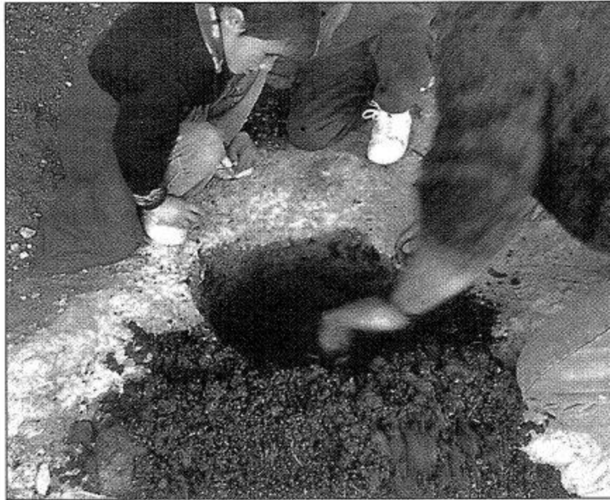
Dos imágenes de la pileta que el Home de la Pólvora de Xodos hacía servir de mortero en la Cova Negra o del Polvorero, en el término municipal de Xodos, aún con restos de aquella actividad.