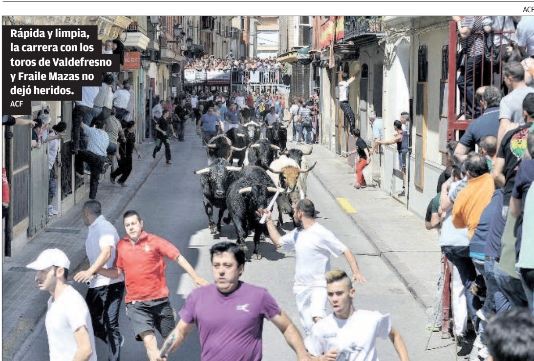
Rápida y limpia, la carrera con los toros de Valdefresno y Fraile Mazas no dejó heridos.