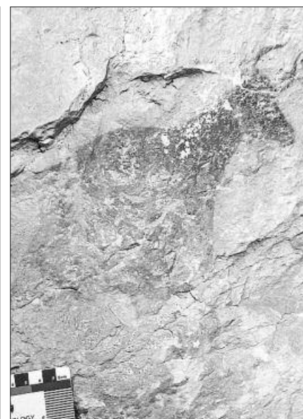
Dos de las imágenes sobre las pinturas encontradas en el término municipal de Vilafranca. TORTAJADA

como el de Vilafranca. Nuevas investigaciones podrían sacar a la luz otras pinturas que no resultan visibles en una primera inspección.