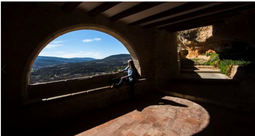
El santuario de la Mare de Déu de la Balma

Miguel Antequera/ Joan Carles Membrado | Departamento De Geografía De La Universitat De València | 18.03.2019 | 17:53