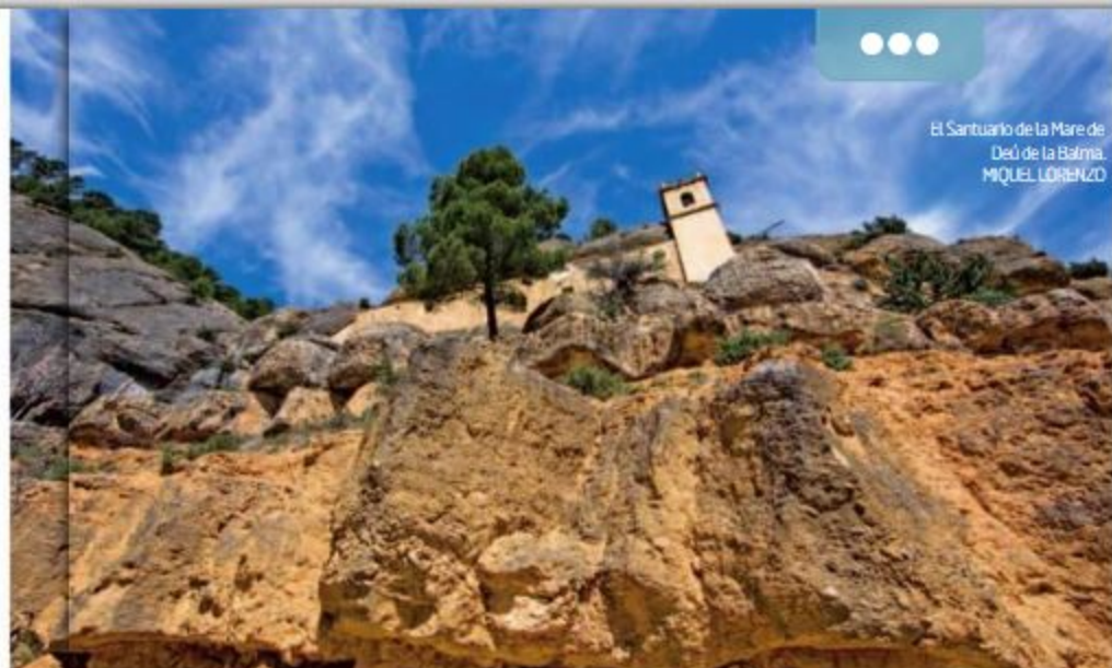
El Santuario de la Mare de Déu de la Balma. MIQUEL LORENZO

Este espacio posee un elevado interés medioambiental, ya que alberga ecosistemas valiosos. Es un área con un gran interés faunístico, ligada sobre todo a ecosistemas fluviales y en la que también existen algunos endemismos vegetales. Se integra en el LIC (Lugar de Interés Comunitario) denominado Riu Bergantes, que en total dispone de 4.402,61 ha, repartidas en los términos municipales de Forcall, Morella, Palanques, Villores y Zorita del Maestrazgo. Pertenecen a la Red Natura 2000. Forma parte, a su vez, de la ZEPa (Zona de Especial Protección para las Aves) de l'Alt Maestrat, Tinença de Benifassà, Turmell y Vallivana. En cuanto a la flora existen numerosos bosques de enebros ( Juniperus communis ), robles ( Quercus robur ) y pinos negros ( Pinus uncinata ). Existen dos Microrreservas de Flora, que son la de Montnegrell (9,98 ha) y la de Les Coves Llongues (2,702 ha), que albergan varios endemismos, entre el que destaca el clavel de balma ( Petrocoptis pardoii ), que es una planta rupícola que suele encontrarse en los abrigos rocosos.