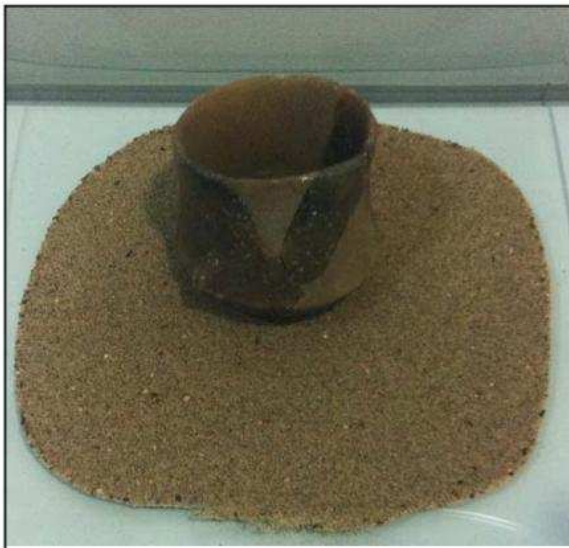
Gotet carenat amb vora recta vertical de tendència exvasada i llavi arrodonit. Està decorat amb un mamellonet just a la carena

(DEP), a qui ja coneixíem per haver col·laborat en el projecte arqueològic que havíem realitzat a la Cova de Pastrana.