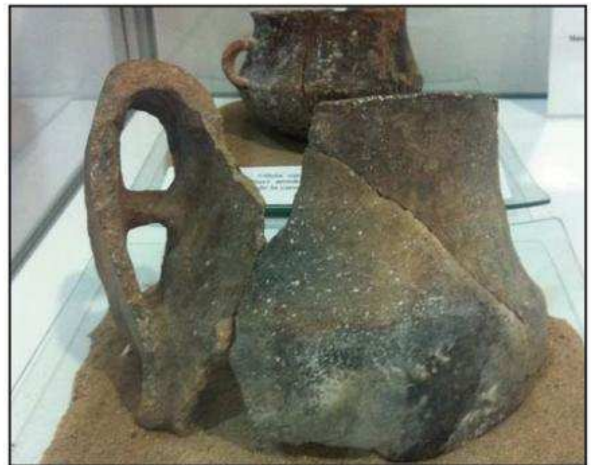
Olla geminada. Pont decorat amb incissions en paral·lel