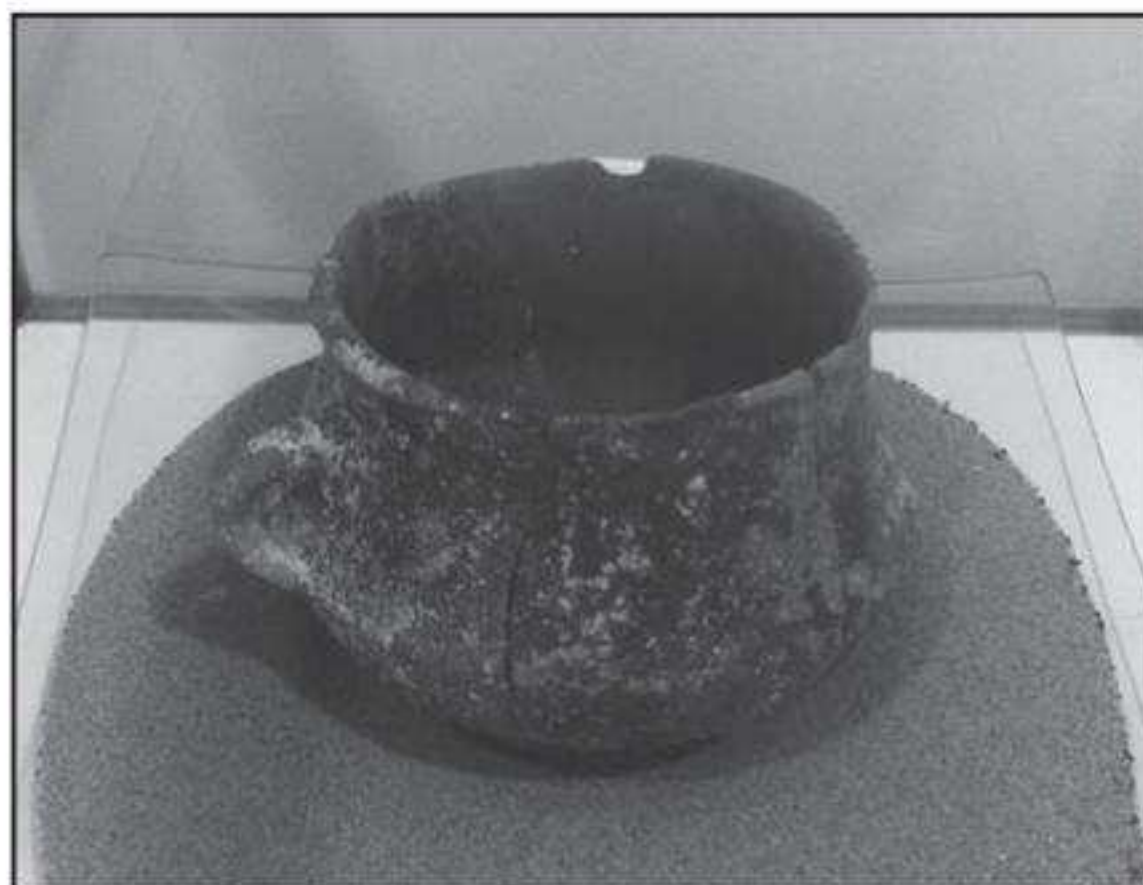
Olla carenada de boca tancada, vora recta vertical i llavi arredonit. Nansa vertical de secció circular per damunt de la carena

També cal fer menció de l'equip tècnic del Servei d'Arqueologia de la Diputació de Castelló, així com al nombrós grup de voluntaris i col·laboradors que els darrers anys han vingut fins ací, duent a terme una gran tasca d'excavació i recerca. Gràcies també a l'Ajuntament d'Alcalà-Alcossebre per prendre part en el projecte de Santa Llúcia, financiant-lo i donar facilitat per a dur endavant aquest projecte tant important que té com a finalitat la recuperació del cicle històric del llomet de Santa Llúcia i el seu entorn.