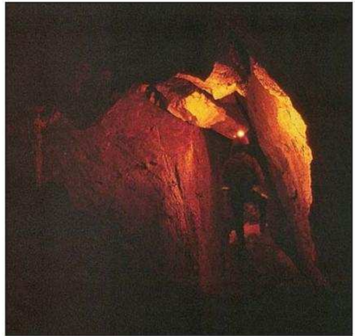
Imatge interior de l'avenc del Depòsit

Aquell diumenge de novembre ja foren recollides les primeres restes arqueològiques. Dies després concertarem una visita al SIAP (Servei d'Investigacions Arqueològiques i Prehistòriques), amb el senyor Francesc Gusi, aleshores cap del Servei d'Arqueologia de la Diputació Provincial