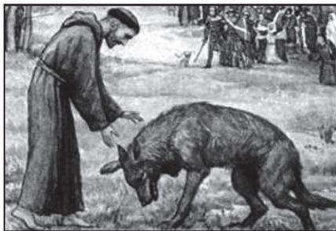
Sant Francesc i el llop de Gubbio

Pot ser aquesta cobla de la tradició oral recuperada i alguns dels topònims als quals hem fet referència de llocs remots, abandonats i poc concorreguts del terme resumeixen ben bé tot allò que hem contat en aquest breu article: El llop podrà, tal vegada, ser eliminat del seu àmbit natural per l'home, però a aquest li serà molt més difícil desterrar-lo del món de la imaginació 6 .