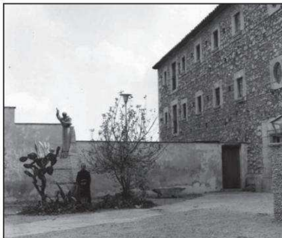
Convent dels Pares franciscans a Alcalà de Xivert

6 "La sombra del lobo. Harro Gorgojo" de Manuel Angel. Publicat l'any 1998 en la Revista de Folklore, número 207.