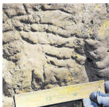
Garra ► Detalle de una huella.

La expedición que obtuvo estos resultados se produjo el 28 de agosto en la Cova del Molí de Dalt de Aín. En ella participaron tres personas, que tenían como objetivo «medir y fotografiar