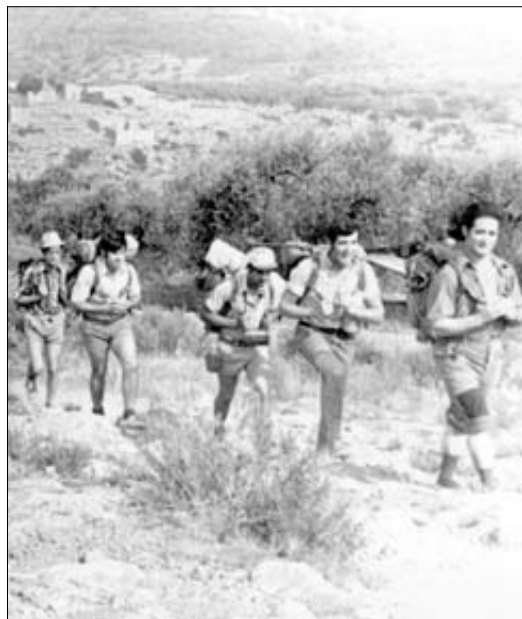
►► Recorrido ► El trayecto hasta la cavidad se realizó a pie.

Inmediatamente, retornaron a Figueroles y dieron cuenta al