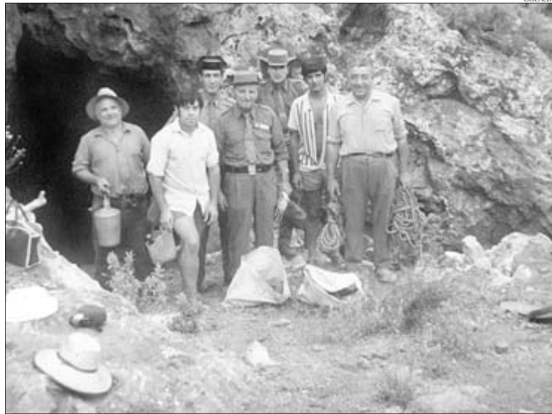
►► Investigación ► La Guardia Civil acudió al lugar para recoger los restos hallados en la cueva.

➔ En la Vall d'Uixó, destacan dos cavidades: la Cova de Pipa y la Cova del Pastor .