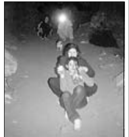
►► Misterio en las cuevas.

HISTORIAS Y LEYENDAS EN LAS CAVIDADES DE NUESTRA PROVINCIA