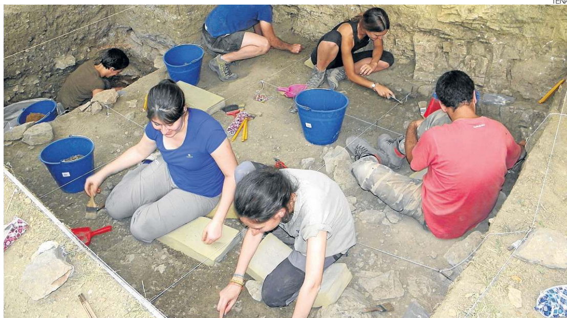
► Arqueólogos y estudiantes se encuentran ahora excavando en el yacimiento de la Cova de la Foia.

La Cova de la Foia es el yacimiento con restos de presencia de humanos más antiguo de Els Ports y uno de los tres más remotos de toda la provincia