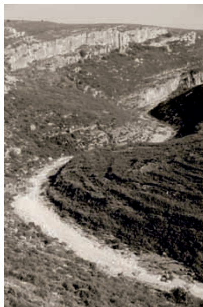
Fig. 5. Les figures femenines de la Fase Centelles solen situar-se en dos ambients geogràfics distints. En aquest cas, al fons, i en la part superior esquerra del Barranc de la Valltorta, s'obrin els abrics de les Coves de la Saltadora en un paisatge trencat i tortuós.

Aigües avall d'aquest abríc, en el tram més accidentat del barranc de la Valltorta, enfront de la confluència del barranc de Matamoros, es troba el cingle de la Saltadora, penya-segat rocós de 200 metres de llargària en què es concentren nou abrics amb art rupestre prehistòric. Aquest conjunt d'abricos constitueix un dels nuclis fonamentals de la Valltorta, tant pel nombre de representacions, superior a les tres-centes, com per la diversitat d'estils. (Fig. 5).