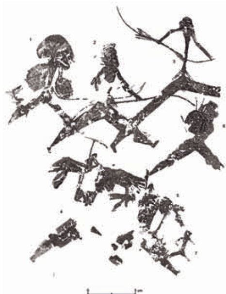
Fig. 3. Escena de l'Abric Centelles (calc segons Institut d'Art Rupestre).

Tenen les cames més curtes, cobertes en dos casos (núms. 4 i 5) per unes peces amples. La figura 4 té pits, per la qual cosa la interpretem com una dona. En les altres, els escrostonats no permeten identificar aquest detall anatòmic, però donada la semblança general, tant en la indumentària com en els implements que porten, considerem que es tracta igualment de dones. Les tres duen a l'esquena el que pareixen unes petites motxilles rectangulars de fons recte. Dos d'elles carreguen sobre les motxilles dos fardells composts d'objectes llargs i lleugerament angulosos i sobre ells dos xiquets, dels quals s'observen clarament el cap piriforme i els braços estesos cap avall, com si s'estiguessen subjectant. Un d'ells està cobert per dos traços en «T», un vertical que sorgeix darrere de la seua esquena i