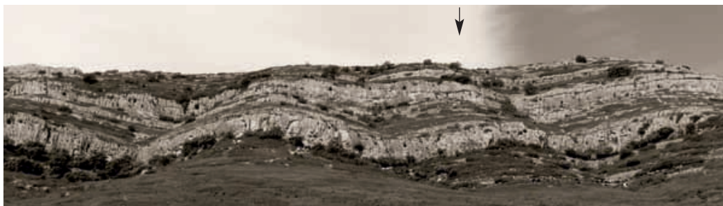
Fig. 2. L'abric Centelles vist des de la llera del barranc de Sant Miquel. A diferència d'altres abrics, des d'aquesta cavitat s'aconsegueix una gran visibilitat, i el mateix abric pot distingir-se des de molt lluny.

Cabrera I) i Art Esquemàtic (barranc d'En Cabrera II) (Viñas, 1981). L'abric s'obri en un llarg faralló rocós (Fig. 2), prop de la zona més alta de la Serra de Narravaes, en el seu vessant sud, per la qual cosa disposa d'àmplia visibilitat en aqueixa direcció. Des de l'abric Centelles s'observa el naixement del barranc de Sant Miquel, tributari del barranc Fondo, Montegordo, la rambla de la Morellana, i una extensa franja de la depressió Tírig-La Barona. Des de la cova Mostela la visibilitat és molt més gran, perquè s'obri en una cota superior des d'on s'observen sense dificultat les mateixes llampades del mar. No obstant això, és pràcticament invisible davant la seua reduïda grandària, aspecte que la diferencia clarament de l'abric Centelles, que per les seues enormes dimensions es converteix en un clar punt de referència. Els abrics del barranc d'En Cabrera tenen una escassa visibilitat, la seua presència només queda confirmada, i des de certa proximitat, per la singularitat de la roca en què s'obrin els abrics sobre els quals s'ha pintat.