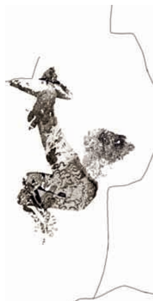
Fig. 4. Figura femenina de les Covetes del Puntal (calc modificat de Viñas, 1982).

La figura està aïllada, ja que, encara que hi ha uns altres motius en l'abric, com ara un cérvol en la part superior, un antropomorf dibuixat cap per avall amb la panxa prominent, interpretat com un cadàver (Viñas 1982: 163), i petites figures humanes, cap d'ells no pot relacionar-se estilísticament amb la