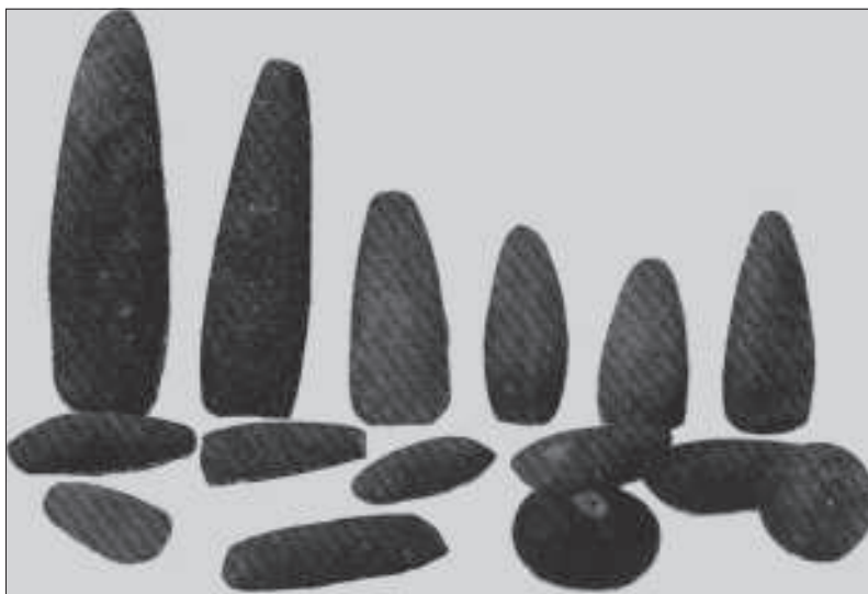
Materials de la Col·lecció Alloza (font Sarthou (1913-15), p. 193)

Pasando luego a enumerar los hallazgos de piedras de rayo verificadas en España, se fijó en las del Maestrazgo en donde también son abundantes y se las conoce con