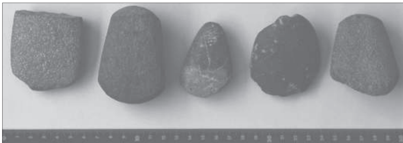
Diversos elements de pedra polida localitzats al terme de Morella, situats cronològicament entre el Neolític i l'Edat del Bronze

La funcionalitat vindria determinada per la documentació d'estructures i la diversitat de materials apareguts en cadascun d'ells, així com per la ubicació dels jaciments que mantenen