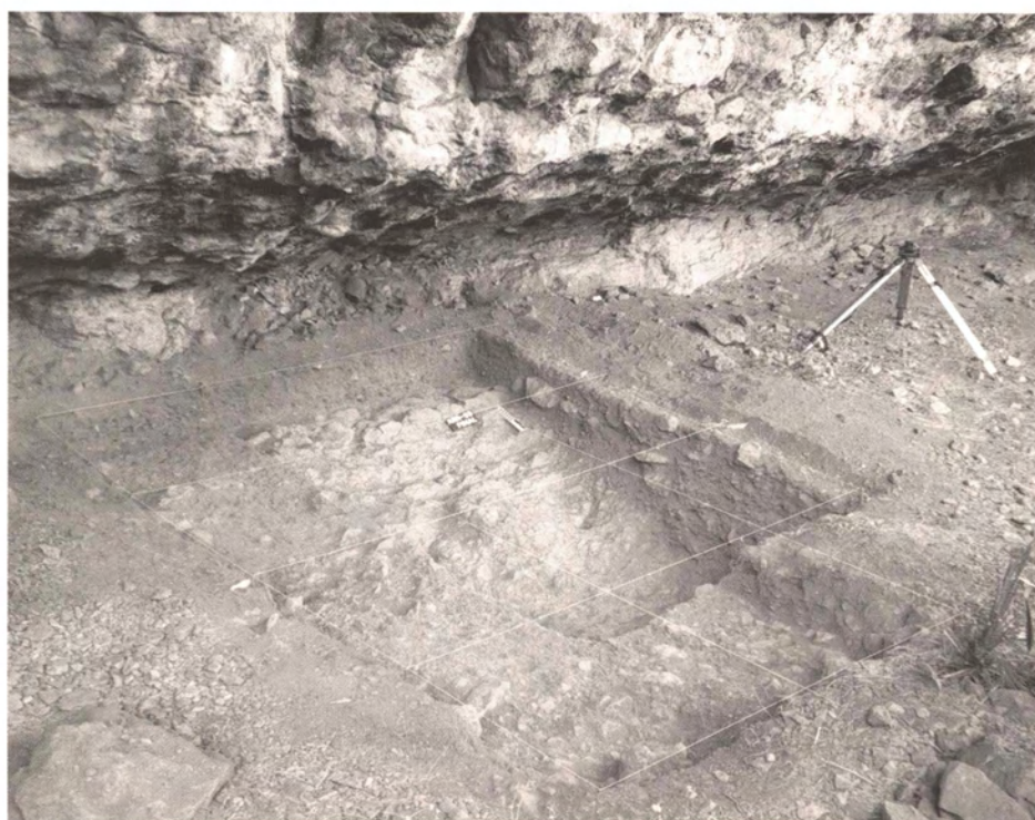
2. Detall de l'àrea excavada, en finalitzar els treballs.