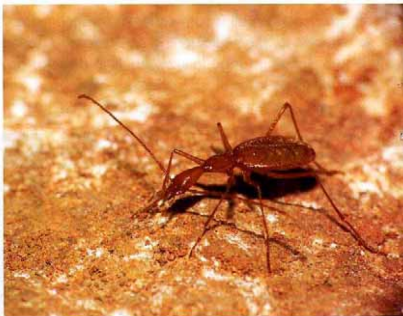
► Ildobates neboti , un curioso escarabajo que habita exclusivamente en el medio subterráneo de la franja litoral castellonense.

El hallazgo de G. smeagol tiene su propia historia. Hacía más de un cuarto de siglo que habían sido recolectados los dos primeros ejemplares, los cuales se conservaban, sin haber sido estudiados, en las colecciones del Museo de Ciencias Naturales de Barcelona (anteriormente Museo de Zoología de Barcelona). Años más tarde fueron capturados otros dos especímenes que queda-