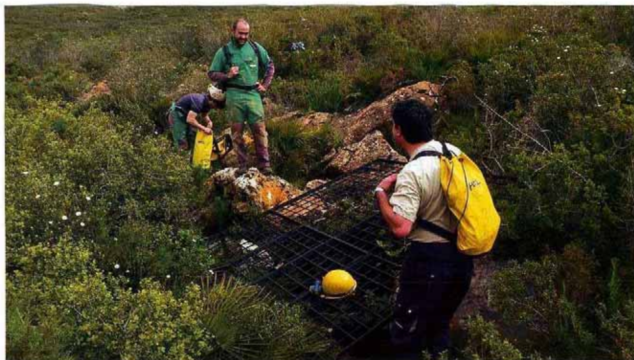
◀ Por razones de seguridad, las bocas de entrada de algunas cavidades de las Alifonaciones Costeras castellonenses están cubiertas por una reja que no impide su acceso, como ocurre en esta sima carcana a Cabanes

allá de lo accesible para el ser humano, dificulta enormemente cualquier evaluación convencional del estado de las poblaciones de estas especies.