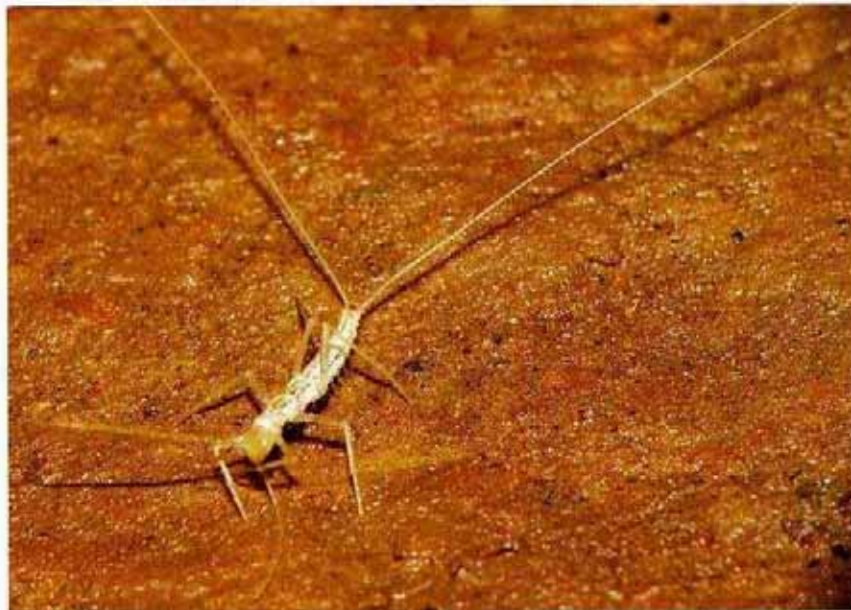
◀ Paratachycampa hispanica , otro hexápodo dipluro ciego y sin pigmentar, como Gollumjapyx smeagol , de apéndices extraordinariamente alargados. P. hispanica es un auténtico fósil viviente de Laurasia, antiguo continente de finales del Mesozoico.

Son cavidades con escasos recursos tróficos, cuyas principales vías de entrada de nutrientes son las raíces de las plantas exteriores, el agua de infiltración, los invertebrados que accidentalmente penetran en su interior y la actividad de pequeños mamíferos como roedores y mur-