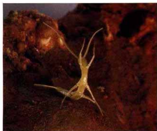
▲ Ejemplar juvenil de Gollumjapyx smeagal , uno de los mayores depredadores subterráneos de la fauna europea.

¿Y qué ocurre en las Tierras Medias de Gollumjapyx smeagal ? En apenas tres pequeñas cavidades (Els Encenalls, Avenc d'en Serenge y Ullal de Miravet), con un re-