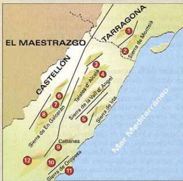
FIGURA 1: MAPA DE LAS CAVIDADES ESTUDIADAS EN CASTELLÓN Y TARRAGONA

Los números corresponden a las cavidades de la unidad geoestructural conocida como Alineaciones Costeras, un punto caliente de biodiversidad gracias a la fauna invertebrada que albergan. Las líneas negras representan fallas, que pueden constituir barreras naturales entre formaciones calcáreas.