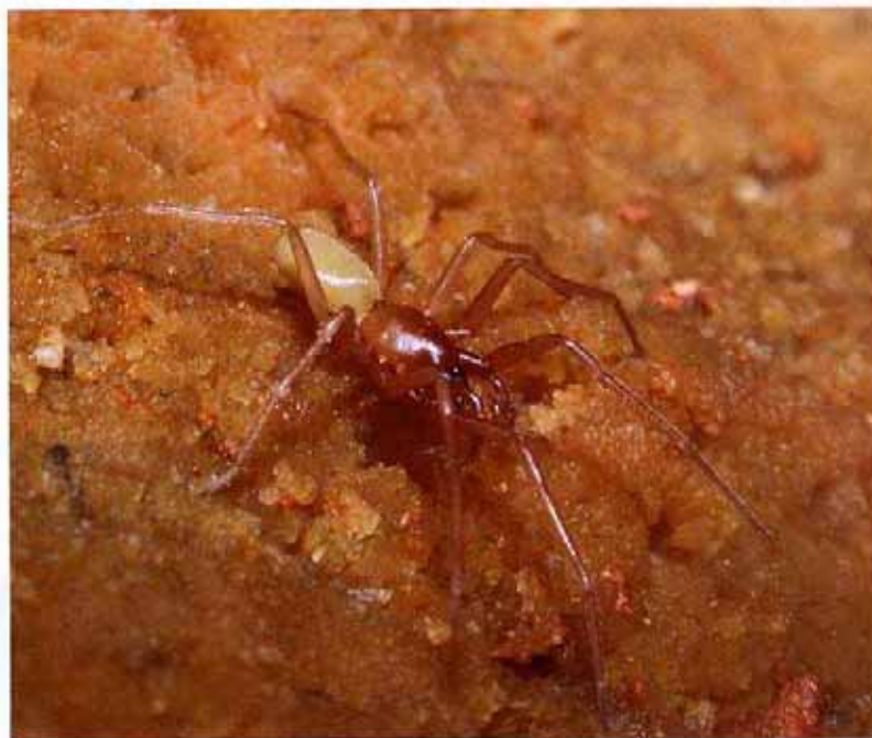
▲ Speleoharpactea levantina , una sorprendente araña ciega de las simas que salpican las Alineaciones Costeras en la provincia de Castellón.

que pertenece al poco conocido orden de los Dipluros. A la luz de los últimos estudios sobre biología molecular, este grupo de artrópodos —que cuenta con algo menos de un millar de especies repartidas por todo el mundo— se sitúa en una posición filogenética próxima a los crustáceos, pese a tratarse de un hexápodo (animales con tres pares de patas) con aspecto de insecto.