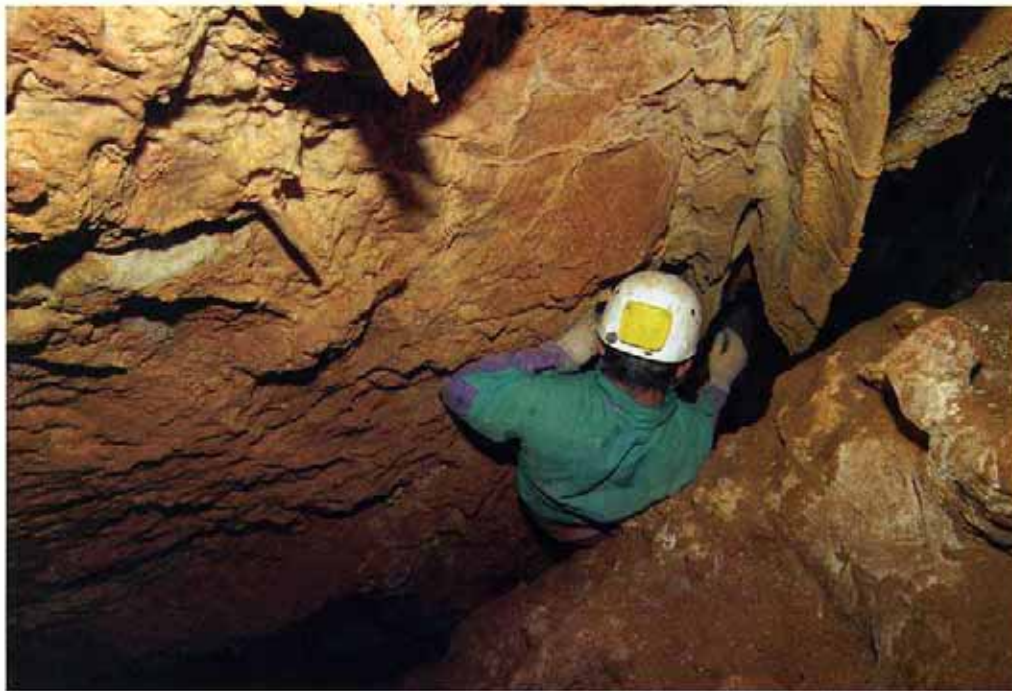
▲ Las dificultades de acceso hacen muy difícil estimar la población de las diferentes especies que habitan en el medio subterráneo.

sistema Ibérico y de las Catalánides o cordillera costera catalana (Figura 1).