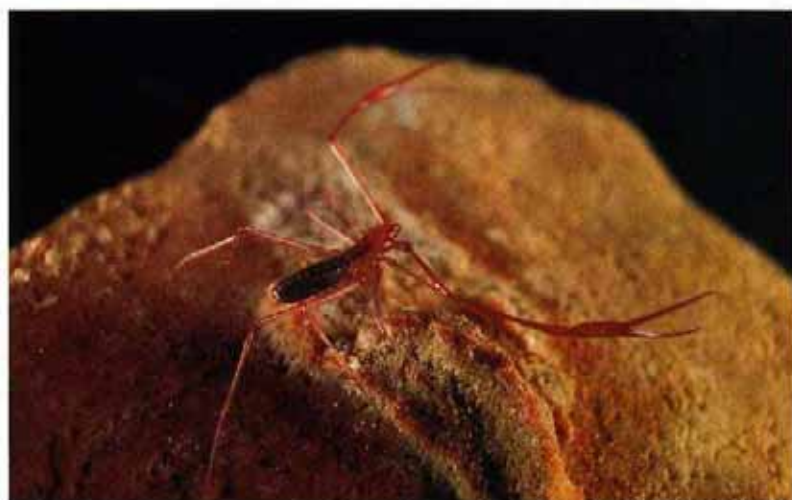
▲ Sin lugar a dudas, Troglobisium racovitzai es el falso escorpión (pseudoscorpión) más espectacular de las cavernas europeas.

corrido de unos pocos centenares de metros y separadas por treinta kilómetros, se reúnen unas veinte especies que son cavernícolas exclusivas y constituyen microendemismos (Figura 2). Buena parte de tal biodiversidad está representada por paleoendemismos, verdaderas reliquias de un pasado arcaico. Este es el caso del escarabajo Ildobates neboti , la araña Speleoharpactea levantina o el dipluro Gollumjapyx smeagol . Además, algunos de los habitantes de este mundo oscuro, como sucede con el pseudoscorpión Troglobisium racovitzai , el dipluro Paratachycampa hispanica , las cochinillas acuáticas Typhlocirolana troglobia y Kensleylana briani o la gambita Typhlatya miravetensis , tienen una distribución disyunta con respecto a otros parientes próximos. Y, en este caso, dichos parientes próximos viven en cavidades situadas ¡al otro lado del océano Atlántico! Es decir, en el continente americano. Estas especies suponen una prueba más de la deriva continental, que condujo a finales del