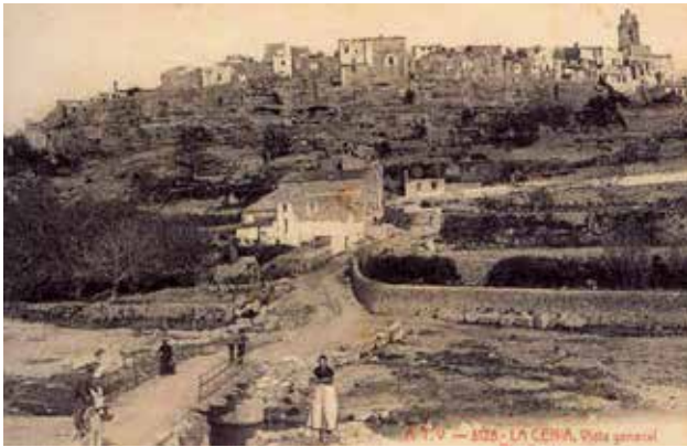
La Sénia.

Representen el lloc a partir d'on s'ha iniciat l'ocupació humana del riu, cosa que fa que siguin d'una gran importància en aquest estudi.