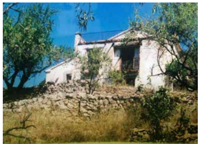
Mas de Parra.

Són molt antics i estan ubicats principalment en la zona muntanyosa del riu (tram alt del riu). A excepció del mas de Parra, els masos estan ubicats per sobre del pantà. Aquest fet s’explica perquè en el tram baix del riu la gent vivia en els nuclis de població existents, cosa que feia que s’instal·lessin els masos en llocs allunyats dels nuclis, on vivien famílies pageses. Els seus noms responen bàsicament al propietari o a l’activitat a què es dedicava el mas. Actualment cap mas es dedica a l’activitat i estan tots deshabitats.