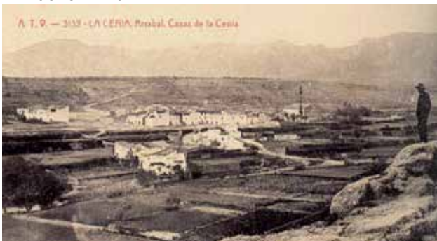
Les Cases del Riu.