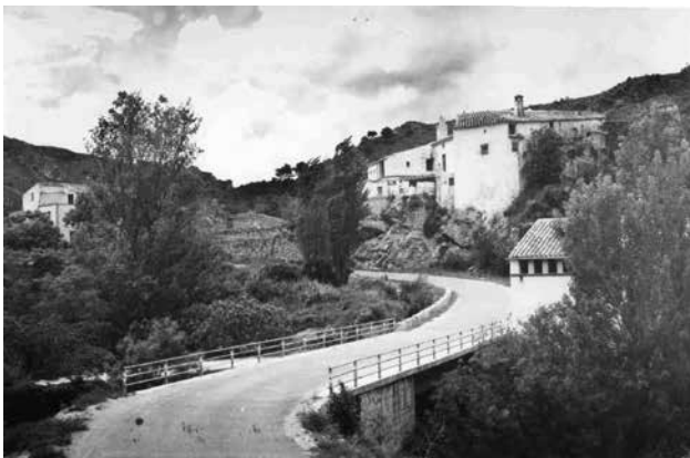
Molí l'Abad.