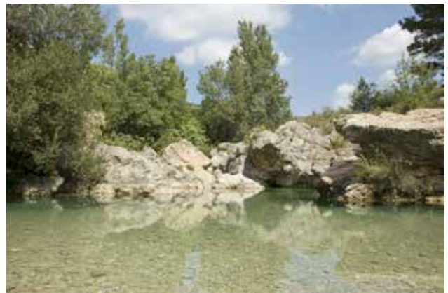
Toll dels Arenals.