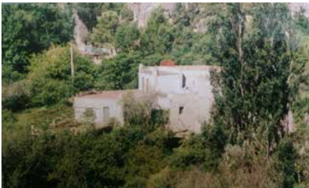
Les Mèlies.