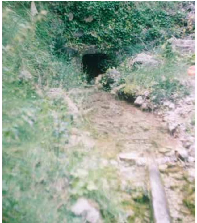
Font dels anoguers.