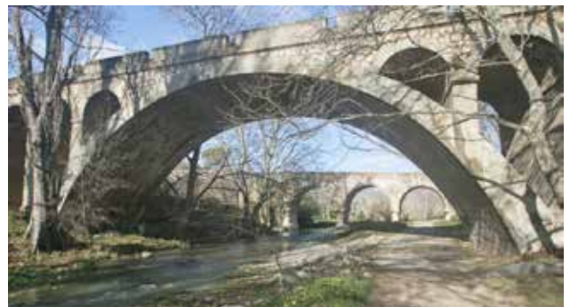
Ponts de les Cases.