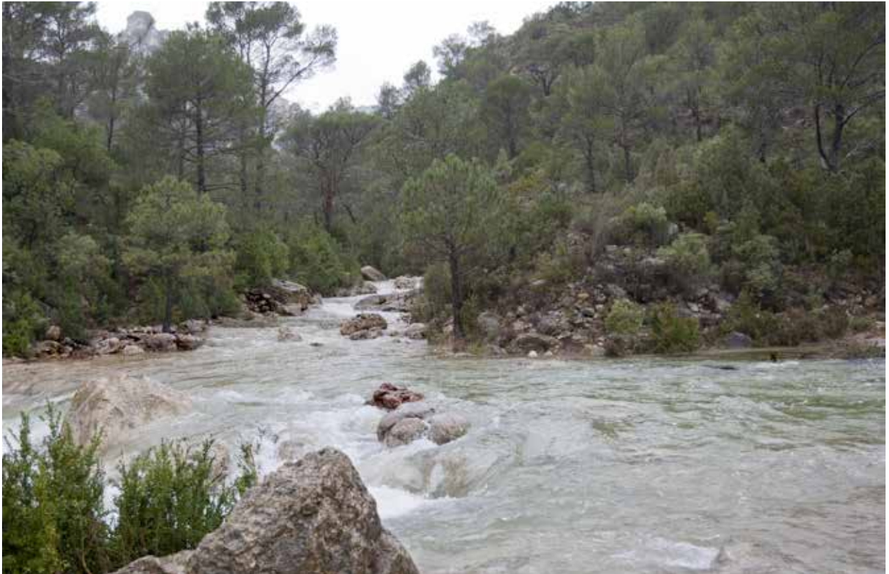
Barranc de la Tenalla, durant la riuada de 2007.