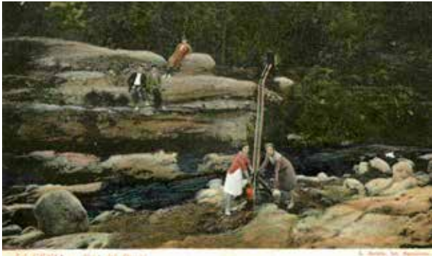
Font del Draper.