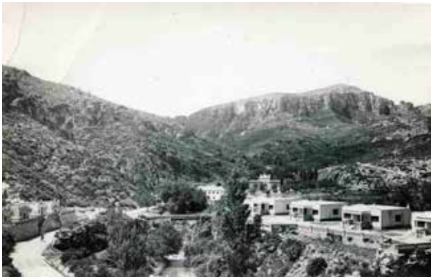
Xalets del Ric i zona de Sant Pere.