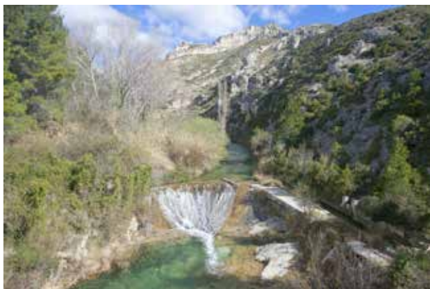
Lo Partidor.