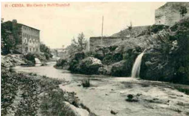
Molí la Vella i molí d'en Guiot.