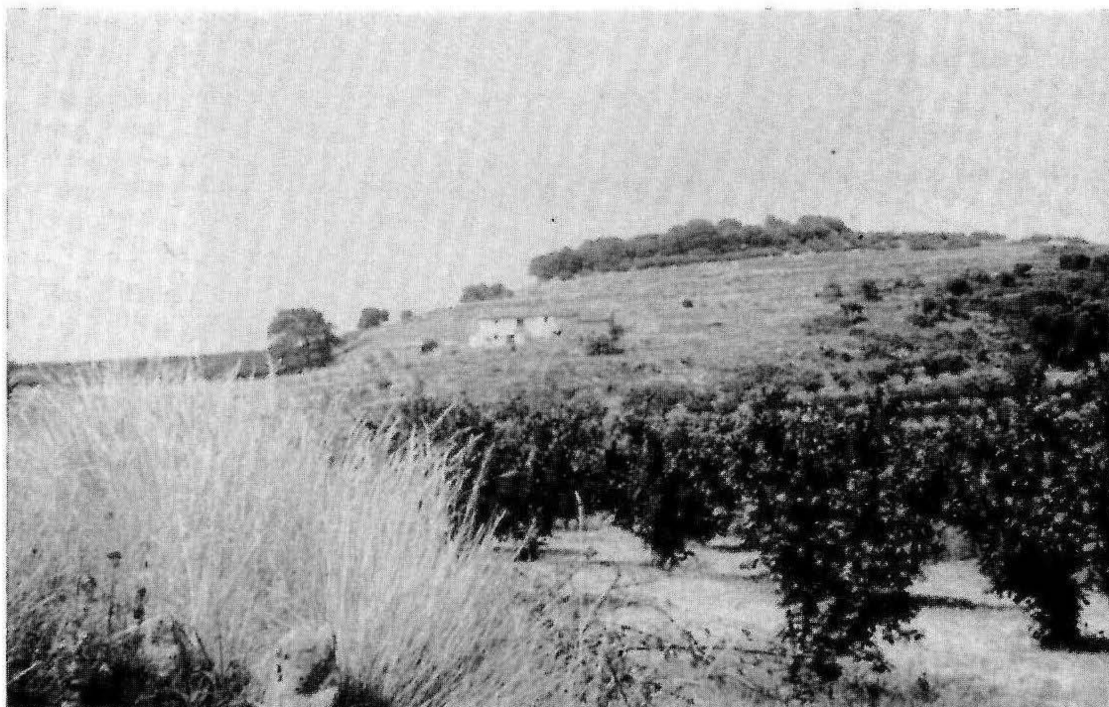
El mas de Giraulo

Per ser abans una construcció baixa com un cau de conills (una "catxapera"). L'obra nova ha estat qualificada fins i tot de "torre". Potser siga denominada així per ironia.