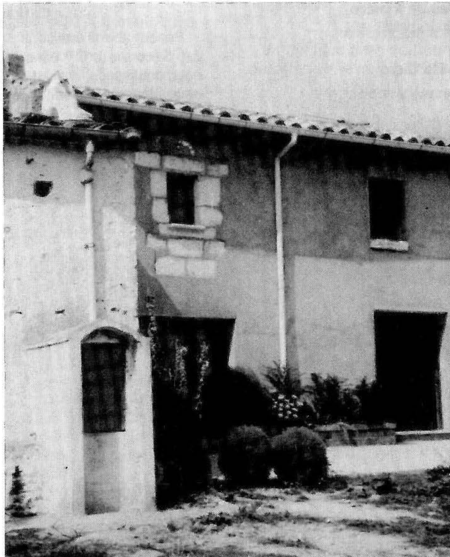
El mas de l'Algar

Per haver-se separat de l'Algar. Era dels Porcar dits de l'Algar al segle XVIII.