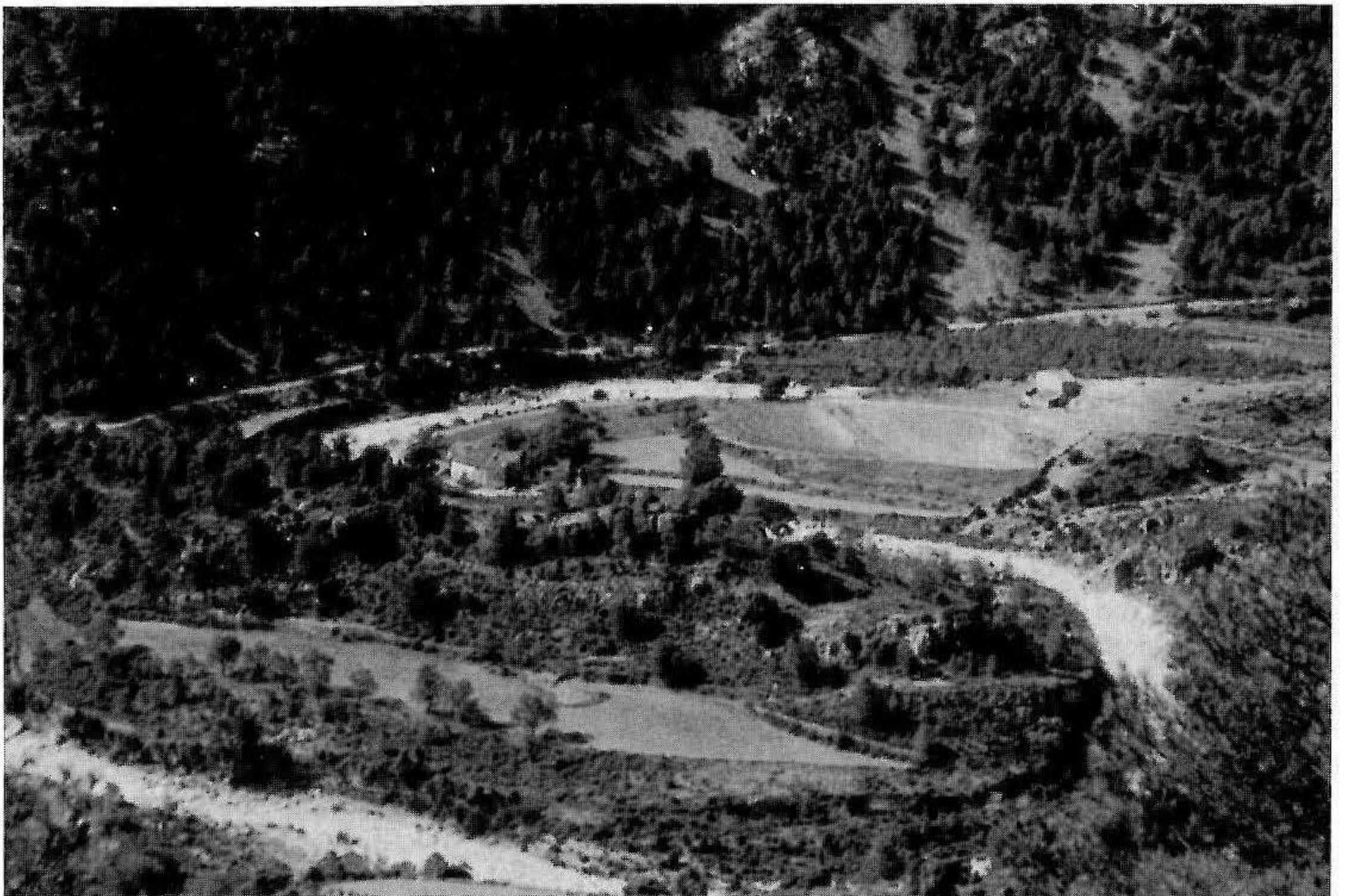
El molí de Colau