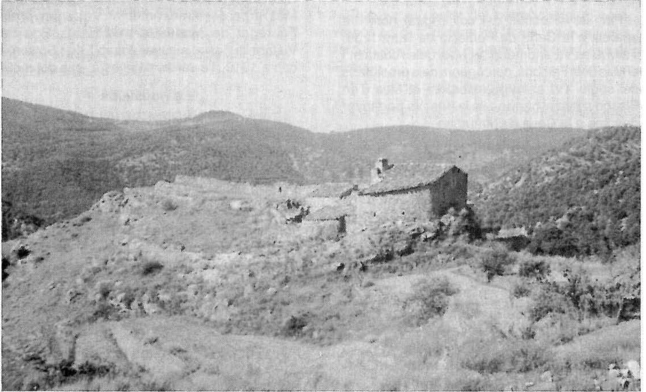
El mas de Forés de Baix